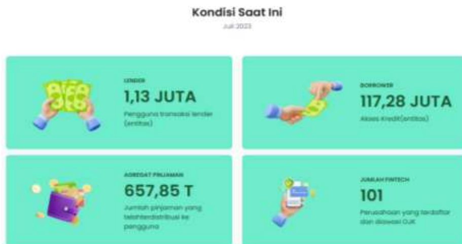
Gambar 1 Lanskap Pendanaan Fintech